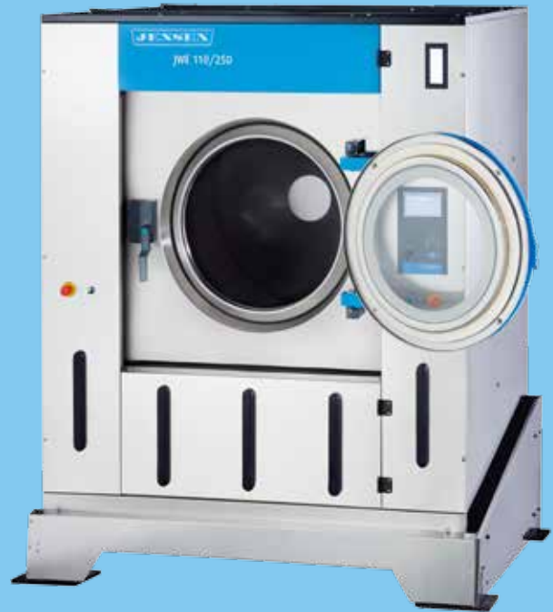
Einfaches Be- und Entladen über die weit aufklappbare große Beladetür und die konische Trommelfläche