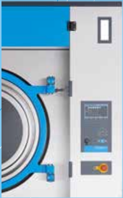
Schnelles und einfaches Einrichten von Waschprogrammen und chemischen Programmen über USB-Anschlüsse