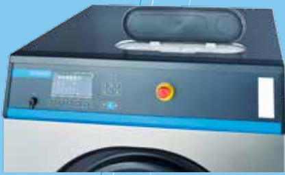
Bedienerfreundlich Waschmitteltrichter an der Oberseite bei JWE 20/45 und JWE 40/90