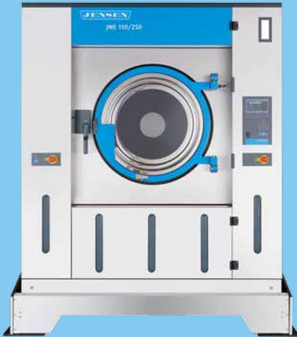
Fernüberwachung und benutzerfreundliche Diagnosefunktionen Sofortiger Überblick über den Maschinenstatus durch intelligente Leuchtanzeige

neben anderen Geräten aufgestellt werden. Das spart Platz für andere Arbeitsprozesse.