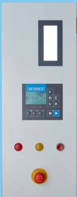
Fernüberwachung und benutzerfreundliche Diagnosefunktionen Sofortiger Überblick über den Maschinenstatus durch intelligente Leuchtanzeige