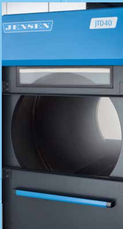
Schnelles Be- und Entladen durch breite Öffnungen mit Schiebetüren