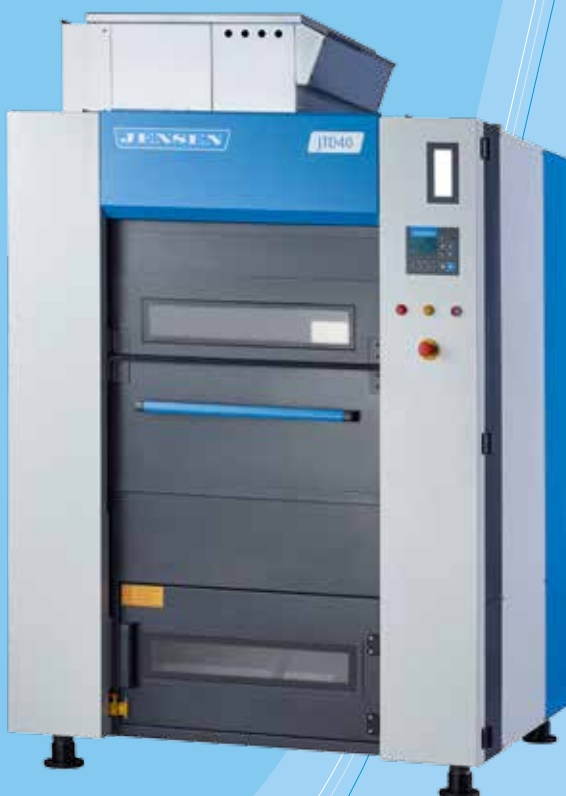
Platzsparend und bedienungsfreundlich Die neuen JTD Trockner setzen neue Maßstäbe.