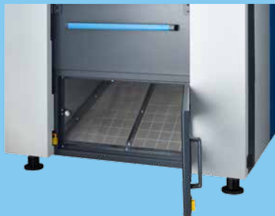
Einfaches Entfernen von Flusen durch leicht zugängliche Luftfilter